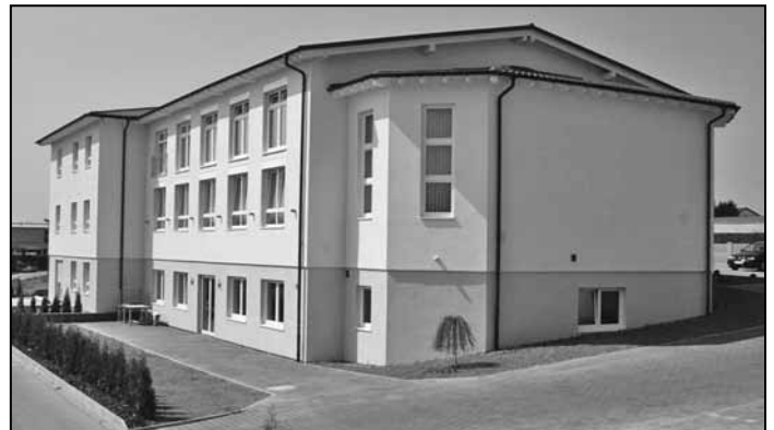
Gemeindehaus von der Ostseite