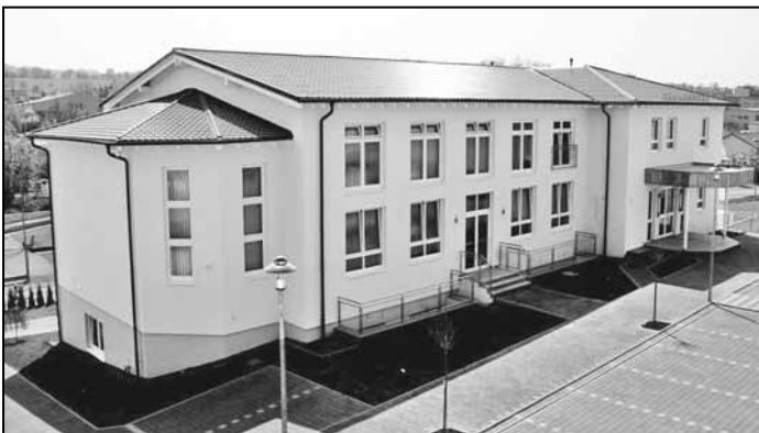
Nordseite, Haupteingang rechts

Manchmal schien es, dass vieles nicht mehr zu bewältigen sei, oder dass die eine oder andere Sache in die Sackgasse führte. Jedoch lehrte uns Gott, diese Angelegenheiten als be-