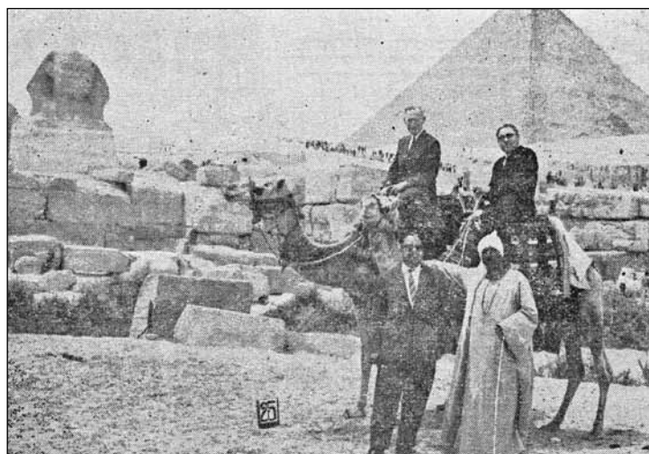
Vor den Pyramiden in Ägypten