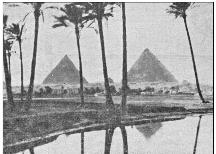
Die Pyramiden in Ägypten

Nach der Frühdatierung sind unter einem Pharaos der 12. Dynastie Joseph und Jakob nach Ägypten gekommen. Wahrscheinlicher ist der spätere Ansatz, nach dem ihre Ankunft in Ägypten mit der asiatischen Hyklosherrschaft in Verbindung gebracht wird. Der Name Hyklos bedeutet vermutlich: „Fürsten der Hirten“, mit geringerer Änderung